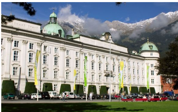
Hofburg Innsbruck Austria