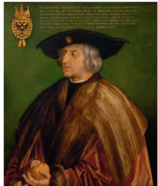
Kaiser Maximilian I.